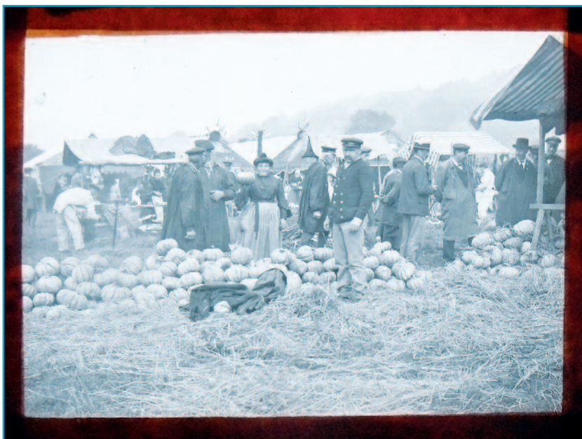
Légende : « Foire de la Saint-Gilles, ou foire aux melons à Saint-Germain-Village », photographie de Gaston Carliez ou d'Eugène Grégoire, diapositive monochrome sur verre, début du 20 e siècle, Collection Musée Alfred Canel (don de M. et de Mme Toulemonde).

© Collections Musée Alfred Canel, Pont-Audemer