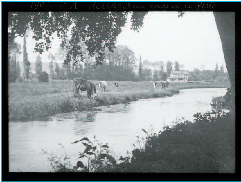
Légende : « Pont-Audemer. Herbages aux bords de la Risle - 1907 », photographie de Gaston Carliez ou d'Eugène Grégoire, diapositive monochrome sur verre, Collection Musée Alfred Canel (don de M. et de Mme Toulemonde).

© Collections Musée Alfred Canel, Pont-Audemer