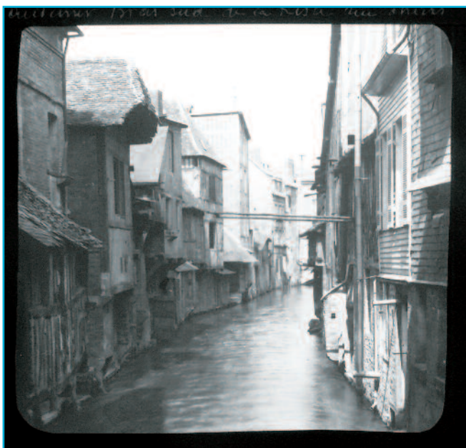
Légende : « Pont-Audemer. Bras sud de la Risle. Rue Thiers », photographie de Gaston Carliez ou d'Eugène Grégoire, diapositive monochrome sur verre, début du 20 e siècle, Collection Musée Alfred Canel (don de M. et de Mme Toulemonde).

© Collections Musée Alfred Canel, Pont-Audemer