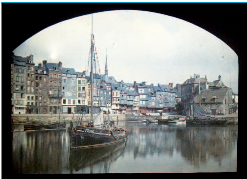
Légende : « Honfleur », photographie de Gaston Carliez ou d'Eugène Grégoire, diapositive monochrome sur verre, début du 20 e siècle, Collection Musée Alfred Canel (don de M. et de Mme Toulemonde).

© Collections Musée Alfred Canel, Pont-Audemer