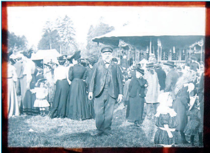
Légende : « Foire de la Saint-Gilles à Saint-Germain-Village », photographie de Gaston Carliez ou d'Eugène Grégoire, diapositive monochrome sur verre, début du 20 e siècle, Collection Musée Alfred Canel (don de M. et de Mme Toulemonde).