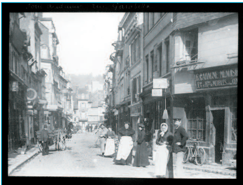
Légende : « Rue Gambetta, Pont-Audemer », photographie de Gaston Carliez ou d'Eugène Grégoire, diapositive monochrome sur verre, début du 20 e siècle, Collection Musée Alfred Canel (don de M. et de Mme Toulemonde).

© Collections Musée Alfred Canel, Pont-Audemer